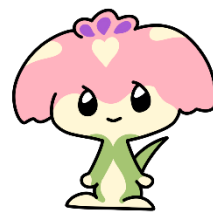
大村市社協キャラクター あいりん