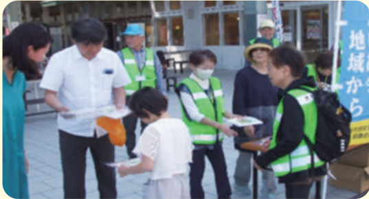
南地区第2：コレモおおむら