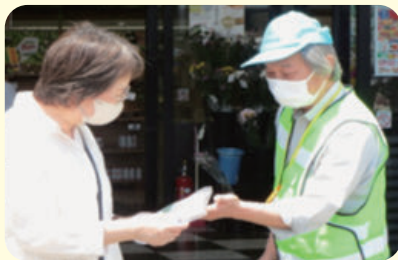
北地区第1：かとりストア

民生委員・児童委員は、5月14日(木)にはさくらホールで総会を、5月16日(土)には街頭PR活動を実施しました。