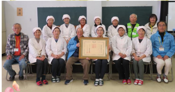
鈴田地区社協給食ボランティアグループのみなさん