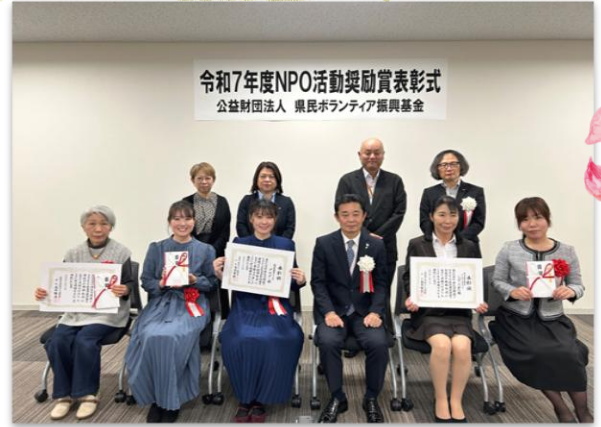
令和7年度NPO活動奨励表彰式 公益財団法人 県民ボランティア振興基金 アニマルレスキューハッピーりぼん(前列右側2名)と あじさいグループ(前列左端)