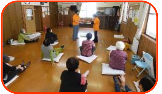
上：岩舟公民館(岩舟・日向平・本小路地域高齢者 独り暮らしを見守る会)での体操指導の様子