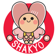
長崎県内社協マスコットキャラクター いこいちゃん

●ホームページ http://www.omura-shakyo.net/ ●E-mail honbu@omura-shakyo.net