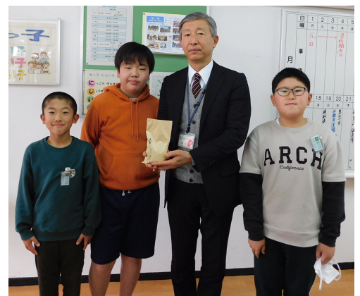
松原小学校のみなさん