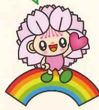
大村市マスコットキャラクター おむらんちゃん